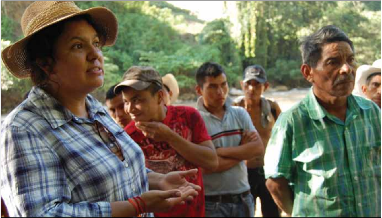
Visita de Berta Cáceres a la comunidad de Río Blanco y al Río Gualcarque. Río Blanco, Intibucá.

“Creíamos al principio que solo la habían golpeado y nos preocupamos porque apenas horas atrás había estado con nosotras hablando de la lucha que hacen en México y de todo eso. Pero fue duro saber que ya no la volveremos a ver y que solo en fotos la veremos”