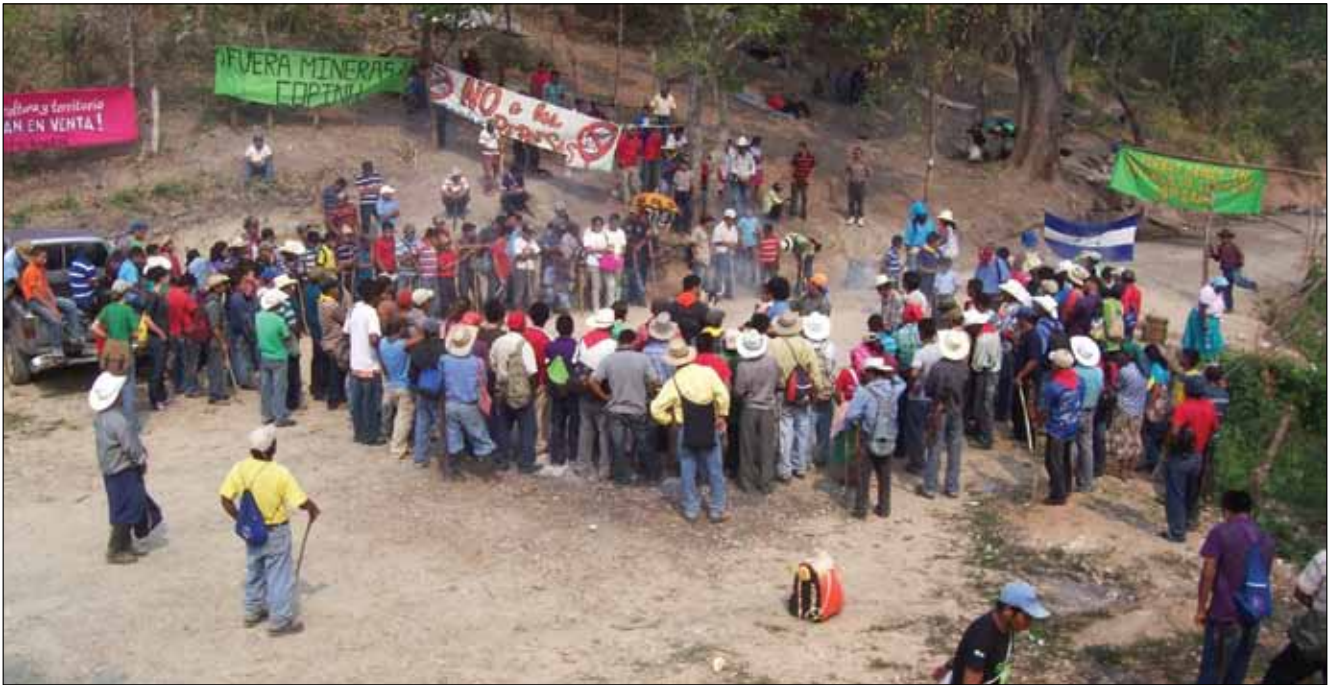
Población de Río Blanco se organiza para defender el Río Gualcarque. Abril de 2013. Río Blanco, Intibucá.

comunidad de Río Blanco, a la empresa SINOHYDRO Corporation Ltd. Esta empresa tiene sede en China y cuenta con una cartera de negocios diversificada que va desde conservación hídrica y construcción hidroeléctrica hasta financiamiento, diseño, implementación y operación de proyectos en infraestructura, en áreas como electricidad, transporte, obras civiles, minería y bienes raíces. 22 Según los datos que publica DESA, el proyecto Agua Zarca que construía en la zona de donde fueron expulsados por las y los Lencas, en la primera etapa, generaría unos 93 Giga watts (GWh) 23 por año.