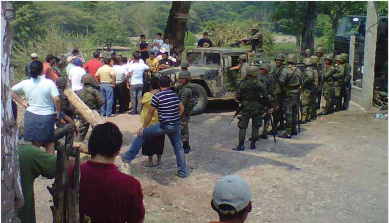
Militares en la comunidad de Río Blanco. Foto tomada por Giogio Trucchi. Rel-UITA (julio 2013). Río Blanco, Intibucá.