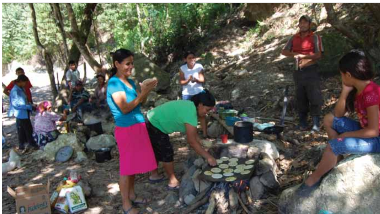
Mujeres Lencas cocinan en las orillas del Río Gualcarque.

“Yo estaba por Tegucigalpa cuando recibí una llamada. Yo hablé con los demás compañeros del COPINH y les dije, miren compas, yo creo que a esta lucha hay que ir y meterse. Llévense sus mochilas y váyanse. Tuve un presentimiento pero algo me dijo que debíamos agarrar las mochilas y así fue. Y llegué a los 4 días y me quedé allá”. 28