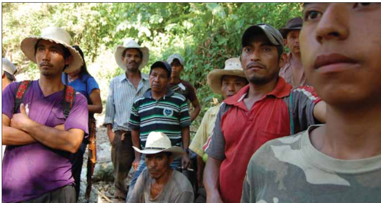
Pobladores a la orilla del Río Gualcarque.