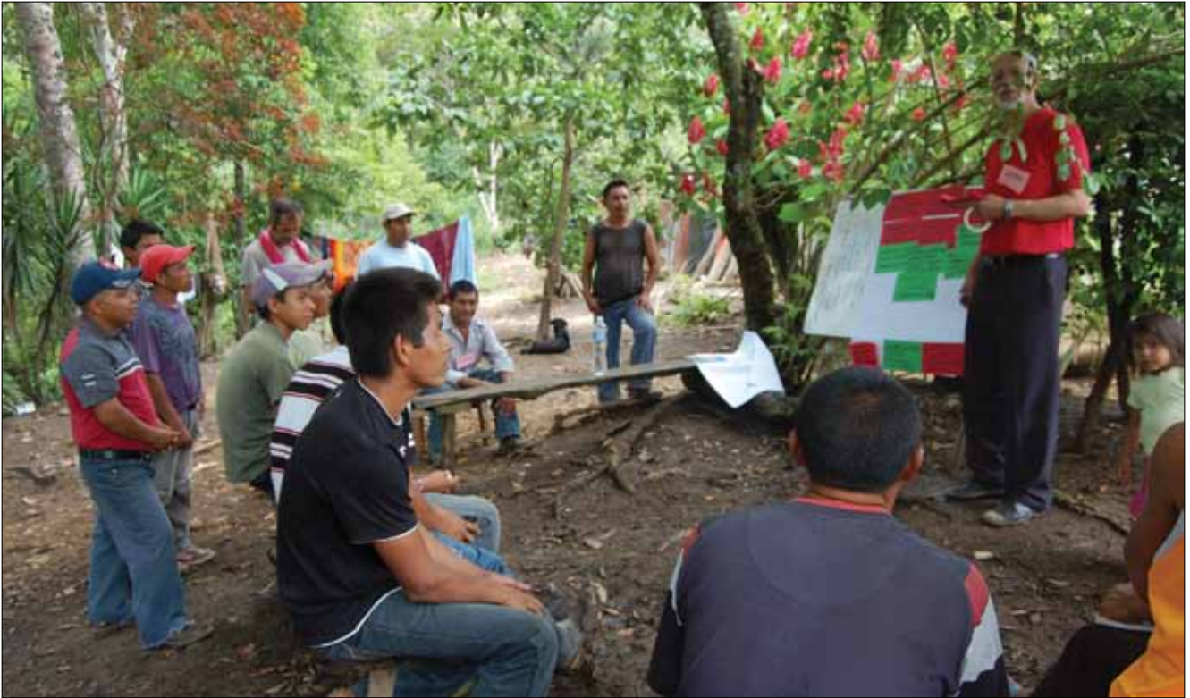
Grupo focal realizado con hombres en la comunidad de Río Blanco. CESPAD (16-3-2015). Río Blanco, Intibucá.