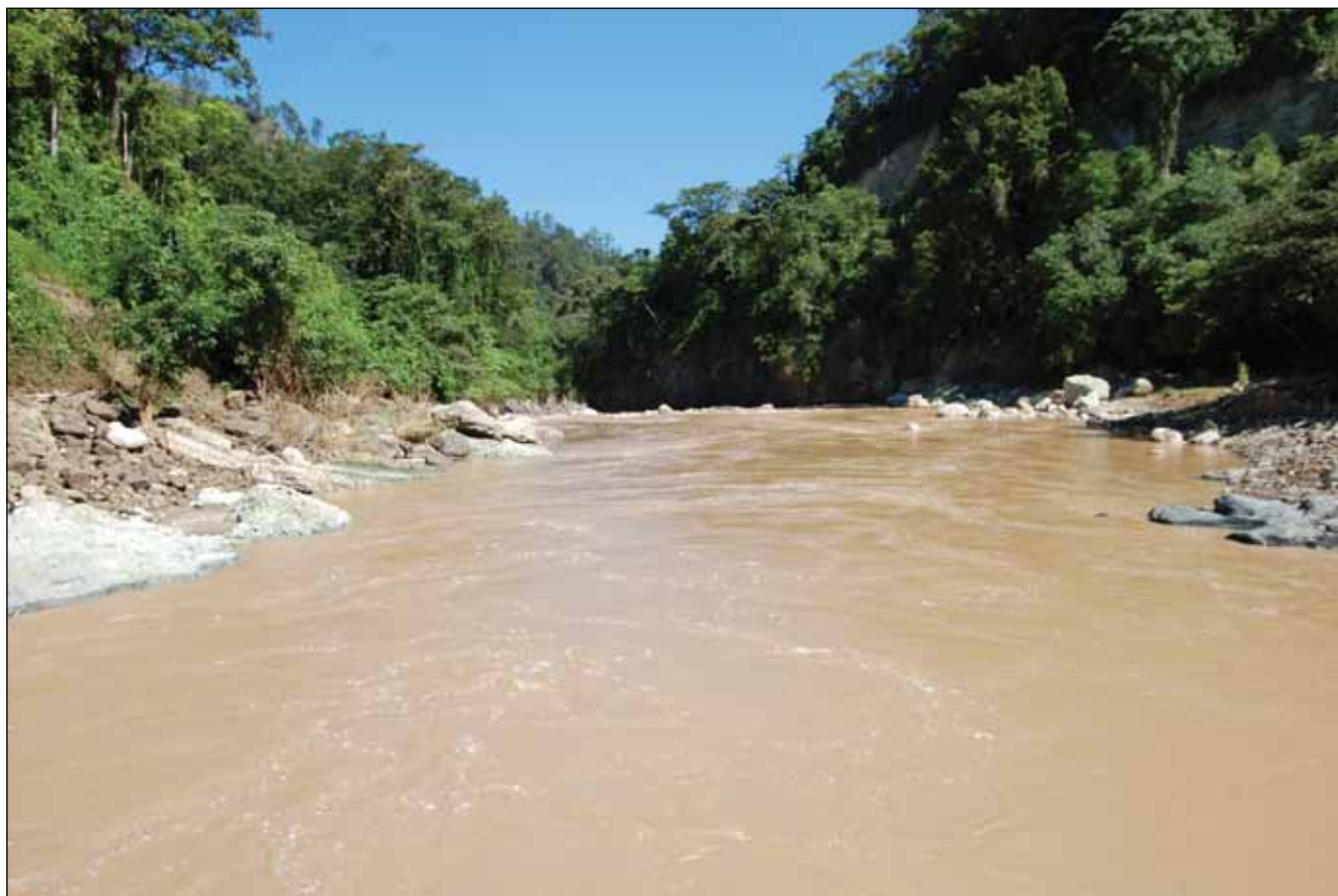
Río Gualcarque, comunidad de Río Blanco, Intibucá.

En suma, la comunidad de Río Blanco es un pueblo que, a pesar de los duros golpes recibidos, muestra la disposición de continuar en la lucha por la defensa de sus recursos naturales y de su río Gualcarque.