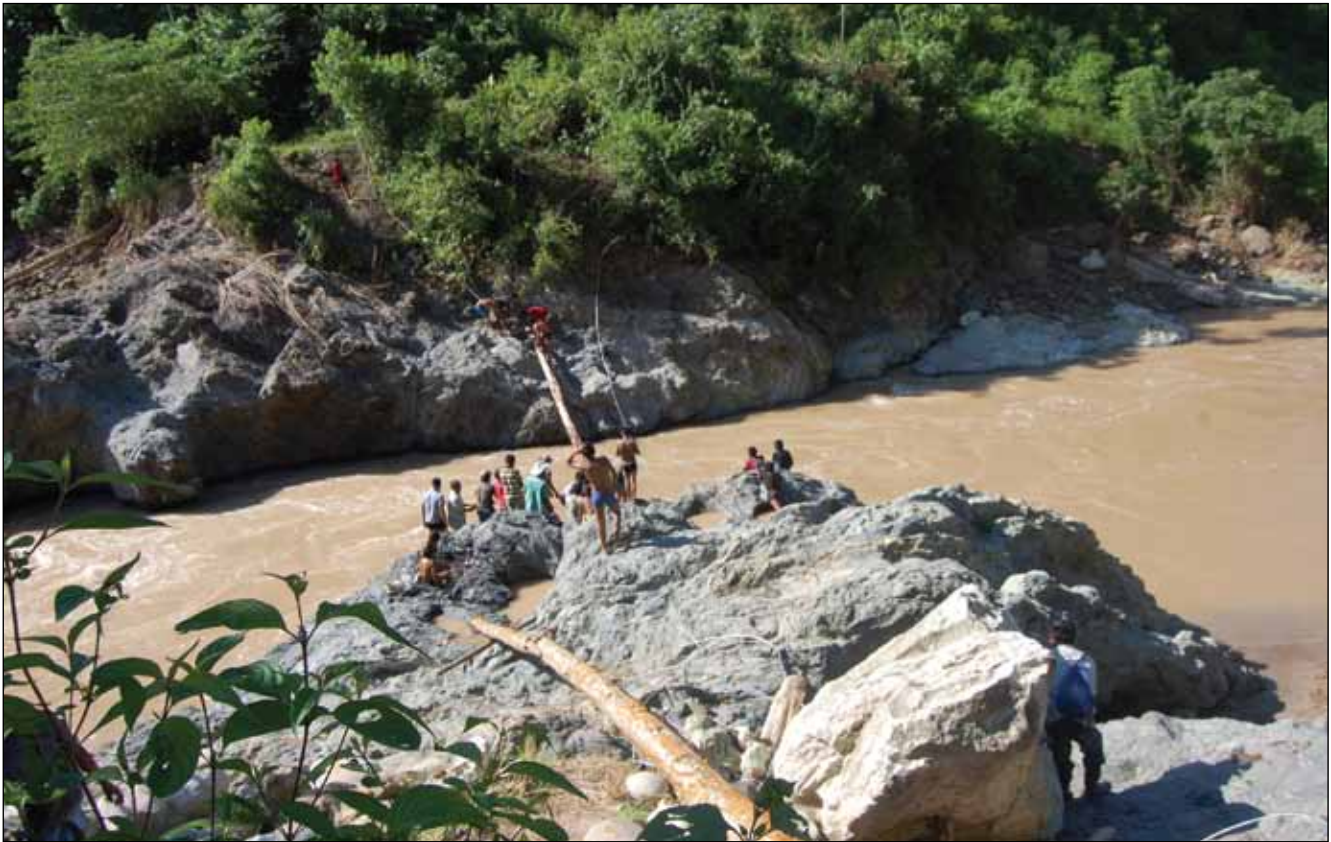
Pobladores de Río Blanco intentan construir puente para cruzar el Río Gualcarque al nuevo plantel de DESA. CESPAD (31-10-2016), Río Blanco, Intibucá.